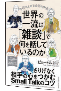
世界の一流は「雑談」で何を話しているのか

「ハイコンテキスト社会」と位置付けられる日本では、自分の意思がその場の雰囲気に流されてしまうことがあります。そうならないために、本書では「明確な意図を持ち、深みのある会話ができる人」になるための方法が紹介されています! コミュニケーションが苦手な人にこそ読んでほしい一冊!