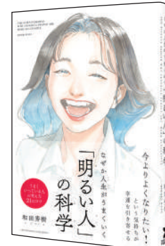
なぜか人生がうまくいく「明るい」の科学

この本は一言で言うと「めっちゃ、ポジティブな本」です! 『どうせ』『だって』『でも』という口癖の人は要注意! ネガティブな言葉を「とりあえず」ポジティブな言葉に変えれば、きっと人生はうまくいく!